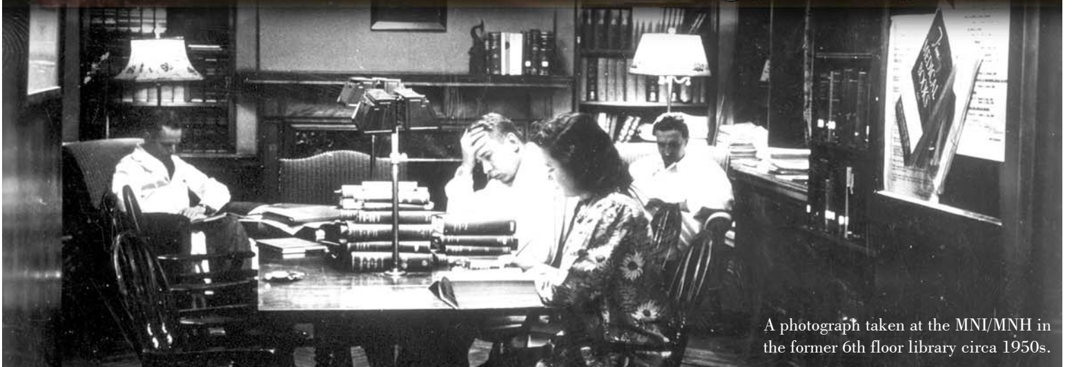
A photograph taken at the MNI/MNH in the former 6th floor library circa 1950s.